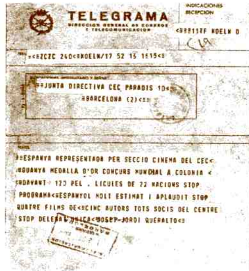
Telegrama enviado a la Junta Directiva del «Centre Excursionista de Catalunya» Co-Fundador de la UNICA y Representante de la misma en España, del cual traducimos su contenido: